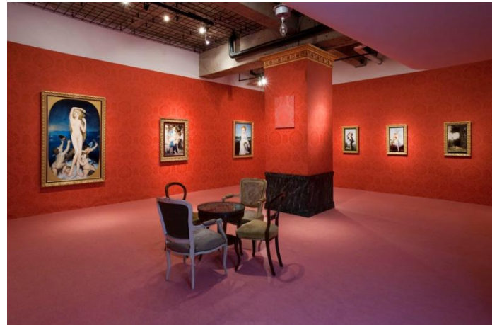
Installation views at nca | nichido contemporary art, 2010